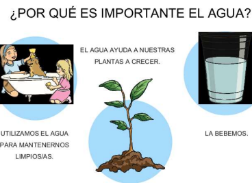
Foto 1 y 2: se muestran momentos en que los estudiantes locutores del curso describen la importancia de este recurso natural y los modos de cuidarlo, reflejando los valores presentes de nuestro colegio. Foto 3: diapositiva que ilustra los beneficios del agua para la actividad formativa.