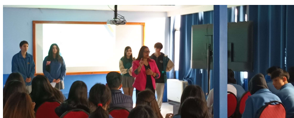
Foto (1 y 2) muestra la presentación de la coordinadora miss Francia Mora en la actividad para II medios del área HC.