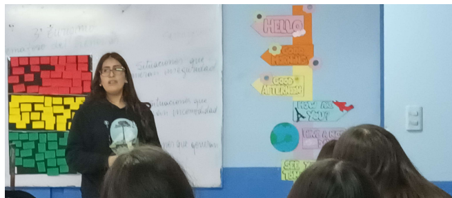
Foto (1) muestra el desarrollo de la actividad en enseñanza básica. Foto (2) se muestra a los estudiantes de III Turismo en el desarrollo de la actividad y dialogando junto a su profesora jefe.