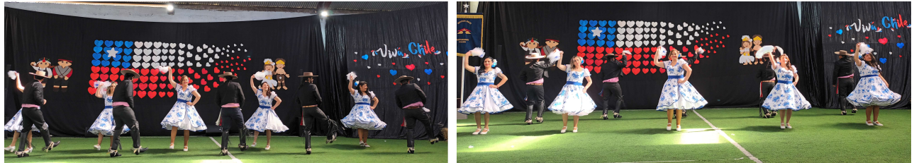
Conjunto de funcionarios: Baile La Cordillerana & La Sajuriana