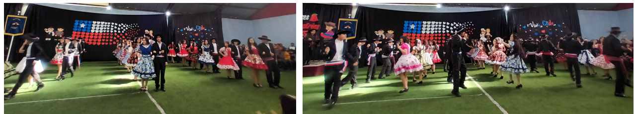
Segundo medio A. Baile: La Jota