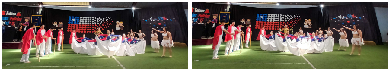
Taller de danza. Baile: Madre Tierra